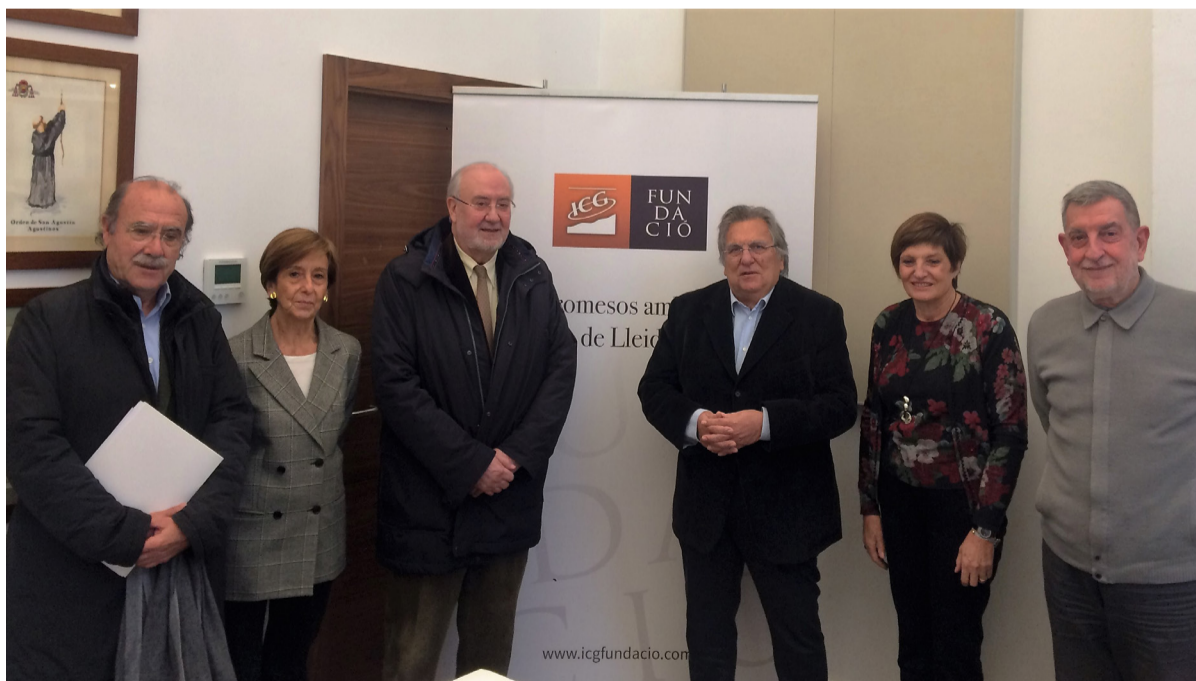
Algunos miembros del grupo “Comprometidos con el futuro de Lleida” en el decurso del encuentro que celebraron.

La próxima reunión de Comprometidos con el futuro de Lleida tendrá lugar el mes de febrero y tratará sobre la Universitat de Lleida y la retención de talento.