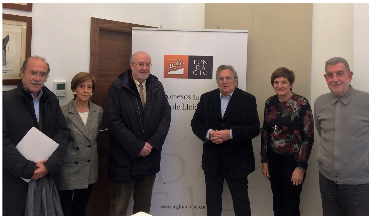
Alguns dels membres del grup “Compromesos amb el futur de Lleida” en el decurs de la trobada que van celebrar.

apropin els nous a la població autòctona, garanteixin la seva integració i evitin la concentració d'aquestes persones en les àrees on es localitza l'habitatge de més antiguitat del municipi. La propera reunió de Compromesos amb el futur de Lleida tindrà lloc el mes de febrer i tractarà sobre la Universitat de Lleida i la retenció de talent.